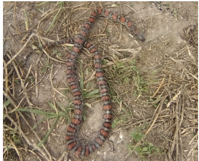
Figure 1. Specimen of Lampropeltis mexicana from the locality of Juandho, municipality of Tetepango, Hidalgo (MZFZ-IMG 280).

Heimes, P. 2016. Herpetofauna Mexicana Vol. 1. Snakes of Mexico . Edition Chimaira. Frankfurt am Main, Germany.