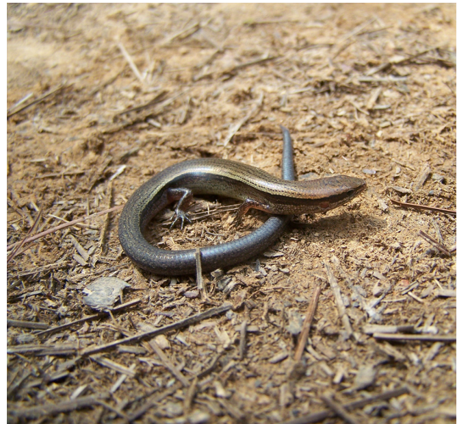
Figure 1. Specimen of Scincella incerta from Parque Nacional Montecristo, departamento de Santa Ana Department.

altas (1500-2500 msnm) en poblaciones aisladas, en la vertiente del Pacífico desde Chiapas, México, oeste de Guatemala hasta el extremo suroeste de Honduras y en la vertiente del Atlántico desde el centro de Guatemala hasta el noreste de Honduras (McCranie, 2018; Valdenegro-Brito et al., 2018). A partir de trabajo de campo, se presenta el primer registro de Scincella incerta para El Salvador.