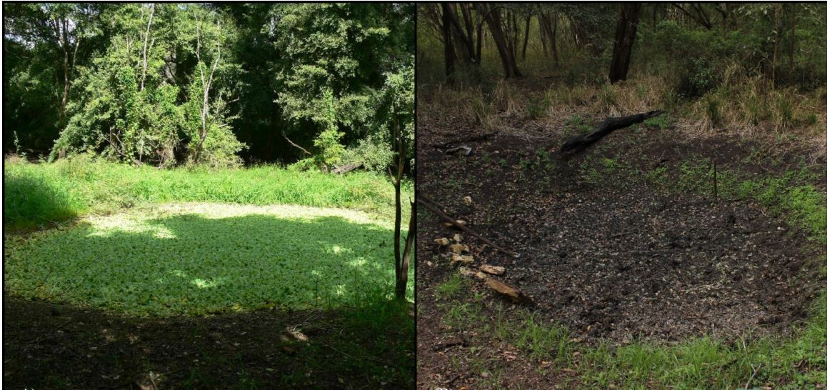
Figure 4. The aguada located in the CEH. Because is a temporary water pond, it keeps water during the rainy season (A), evaporating it during the dry season (B).