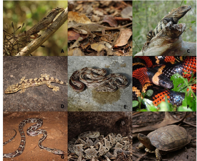
Figure 3. Some species of reptiles recorded in the CEH. Norops lemurinus (A), Norops tropidonotus (B), Ctenosaura similis (C), Thecadactylus rapicauda (D), Boa imperator (E), Lampropeltis abnorma (F), Pseudelaphe phaescens (G), Crotalus tzabcan (H), Rhinoclemmys areolata (I).

Del total de especies, 18 (cuatro anfibios, 14 reptiles) se encuentran en alguna categoría de riesgo en la NOM-059-SEMARNAT-2010, donde el 77.8% se encuentra en la categoría de