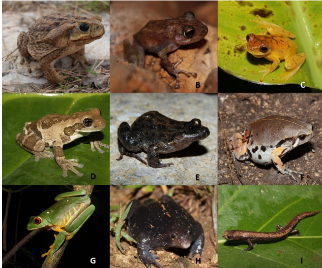
Figure 2. Some species of amphibians recorded in the CEH. Rhinella horribilis (A), Craugastor yucatanensis (B), Dendropsophus microcephalus (C), Trachycephalus vermiculatus (D), Leptodactylus melanonotus (E), Hypopachus variolosus (F), Agalychnis callidryas (G), Rhinophrynus dorsalis (H), Bolitoglossa yucatanana (I).