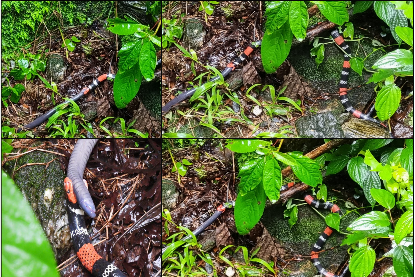
Figure 1. Predation event by Micrurus ancoralis jani on Oscaecilia polyzona . For more details, see the video of the event ( https://youtu.be/X0pmoxwfrng ).