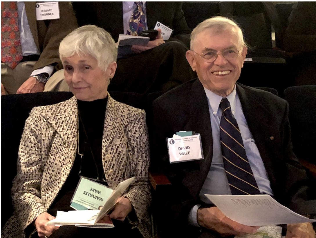
Figure 2. David and Marvalee Wake at a National Academy of Sciences induction ceremony in 2018.

Dave fue una figura destacada en biología evolutiva y herpetología con una combinación de agudeza intelectual, integridad ética, impulso y pasión por compartir. David fue el principal experto mundial en salamandras y uno de los primeros en advertir sobre una disminución precipitada de las poblaciones de ranas, salamandras y otros anfibios en todo el mundo. Observó, de primera mano, las catastróficas declinaciones de salamandras en varias localidades de México (Parque Nacional El Chico, Puerto del Aire, Cerro San Felipe). Más aún, su capacidad de integración, su inmejorable memoria y su gran capacidad de síntesis ubicó a Dave como líder en el campo de la biología evolutiva. Tenía una visión de la ciencia centrada en el taxón, con las salamandras pletodóntidas en el centro de todo lo que hacía. Utilizó el conocimiento generado de las salamandras y no tuvo reparo en adoptar nuevas tecnologías, para generar algunas de las ideas más evocadoras sobre el cambio evolutivo en salamandras.