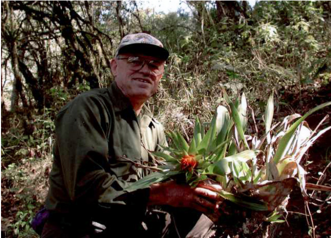
Figure 3. David B. Wake with a bromeliad looking for salamanders in Veracruz, Mexico in 2003. Photo taken by James Hanken, from MVZ Archives, image no. 11806.

Figura 3. David B. Wake con una bromelia buscando salamandras en Veracruz, México en 2003. Foto tomada por James Hanken, imagen de los Archivos del MVZ imagen no. 11806.