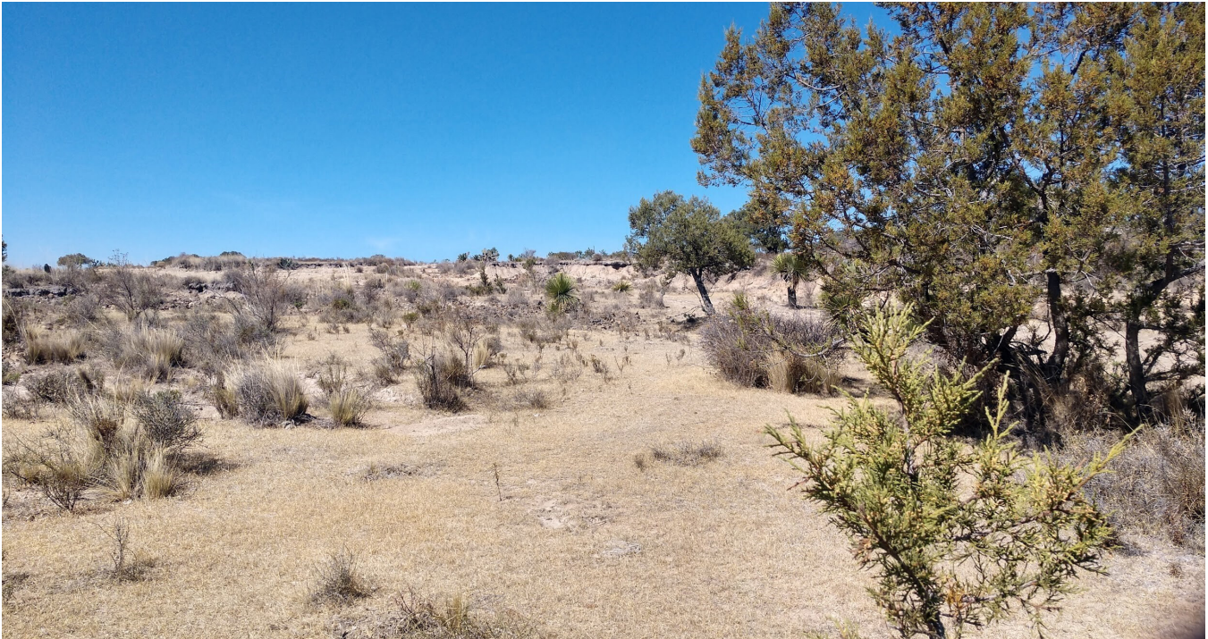
Figure 3. Habitat where the Crotalus intermedius specimen was found (MZFZ-IMG-341), locality of San Sebastian, Apan, Hidalgo.