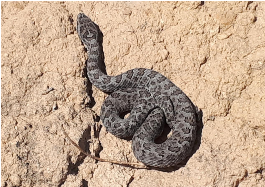
Figure 1. Crotalus intermedius (MZFZ-IMG-341) from the San Sebastian locality, municipality of Apan, Hidalgo, Mexico.

registro más cercano de la especie, encontrado en la Sierra de las Navajas en el municipio de Singuilucan (CH-CIB 61; Fernández-Badillo et al., 2016; Fig. 2). La serpiente fue encontrada viva y fotografiada por Mario Hernández Medina dentro de un cultivo de cebada rodeado por matorral xerófilo (Fig. 3). Posteriormente, el 14 de mayo de 2021 a las 16:30 h, dentro del mismo núcleo