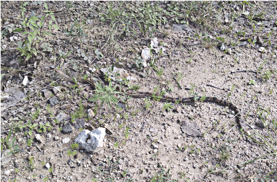
Figure 1. Specimen of Pituophis lineaticollis from the locality of Río Hondo, Municipality of Santa María Peñoles, Oaxaca (UTADC 9745).

Coronel et al., 2021). El váucher fotográfico fue depositado en la colección digital de la Universidad de Texas en Arlington (UTADC 9745). La identidad de la especie fue verificada por Ricardo Palacios Aguilar. La especie se distribuye desde el centro de México hasta Guatemala (Heimes, 2016). En el estado de Oaxaca, P. lineaticollis ha sido registrada en cinco subprovincias fisiográficas (Mata-Silva et al., 2021): Fosa de Tehuacán, Montañas y Valles del Occidente, Sierra Madre de Oaxaca, Sierra Madre del Sur y Valles Centrales de Oaxaca. En el mismo estado, la especie puede ser encontrada en diferentes hábitats