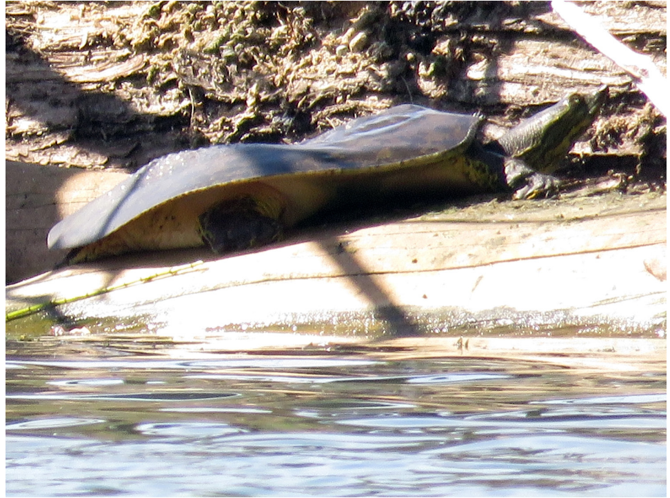
Figura 2. Individuo de Apalone spinifera en una isla del lago del Parque 3 de Febrero, Buenos Aires, Argentina (CFA-101).