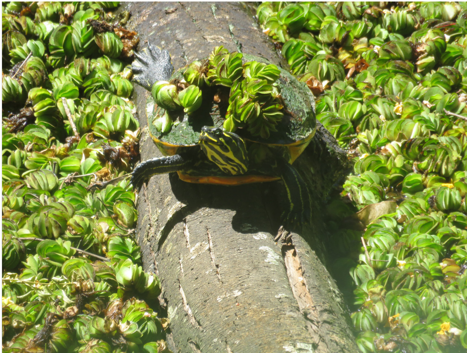
Figure 3. Individual of Pseudemys nelsoni in a channel of the Reserva Ecológica Costanera Sur, Buenos Aires, Argentina (CFA-104).