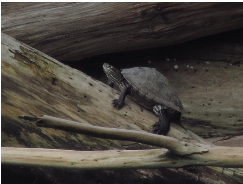
Figure 1. Individual of Graptemys ouachitensis on the lake edge of 3 de Febrero Park, Buenos Aires, Argentina (CFA-102).

El 21 de noviembre de 2020 se observó un adulto de Graptemys ouachitensis a las 15:28 h (Fig. 1) en el borde del lago del Parque 3 de Febrero, Buenos Aires, Argentina (34.5580° S, 58.4330° W;