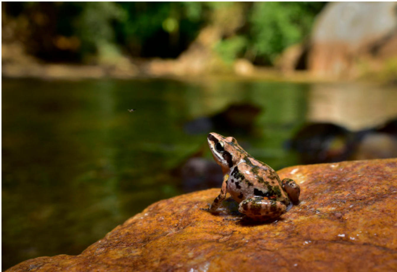
Figure 2. In situ photograph of Eleutherodactylus albolabris found in Zihupoloya, Cuauatepec, Guerrero, Mexico.