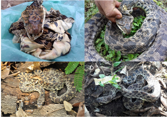
Figure 2. Pictures of specimens of Pituophis catenifer registered in Hidalgo, México. Localities: a) Valle Verde (CH-CIB 113); b) Zacayahual (CH-CIB 5028); c) Cececamel (CH-CIB 99), d) Tepeolol (CH-CIB 115).